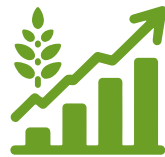
Habilitación o Avío